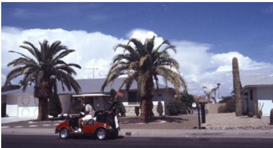
Der Golfwagen als Fortbewegungsmittel in Sun City/Phoenix

50 % der US-Bewohner lebten 2000 nicht auf dem Lande und nicht in der Stadt, sondern in Vorstädten.