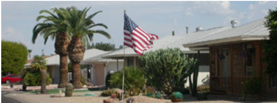
Antiseptische Rentneridylle in Sun City/Phoenix

Nicht nur in Fachzeitschriften, auch in der Tagespresse und den Medien ist inzwischen von Rettungsschirmen und frischem Geld zu lesen. Die von den USA ausgehende Weltfinanzkrise hat nicht nur faule Kredite und toxische Wertpapiere, bad banks und systemische Risiken als neue Begrifflichkeiten kreiert, sondern prekäre globale Abhängigkeiten deutlich gemacht. Was als „Subprime-Krise“ in den USA begann hat mit seinen Weiterungen inzwischen auch andere Immobilienmärkte von Dubai bis Moskau mit in einen gefährlichen Abwärtsstrudel gerissen. Dirk Schubert zeigt Hintergründe auf.