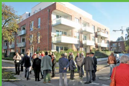
Vertreter-Rundfahrten durch unsere Wohnanlagen in Hamburgs Westen

darf von nur 70 Prozent eines vergleichbaren Neubaus nach Energieeinsparverordnung.