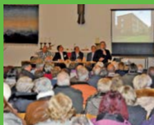
Konstruktiver Austausch mit unseren Mitgliedern bei anstehender Instandhaltung und Modernisierung