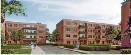
Rimberiweg: Seit Sommer 2013 entstehen 40 neue Wohnungen