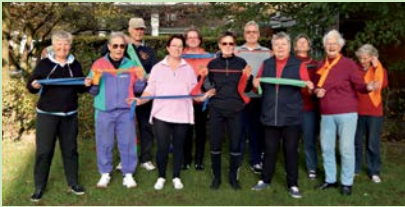
Sportliche Tierparkallee: Bewohner nutzen Fitness-Angebot für Ältere