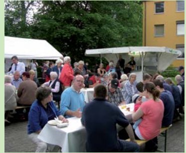
Jubiläumfest: 40 Jahre Wohnanlage Schwarzenbek

Wohnungswechsel oder im Zuge energetischer Maßnahmen insgesamt 183 Wohnungen (Vorjahr: 162) modernisieren.