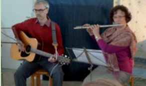
Musizieren in Winterhude: ein Beispiel vieler Nachbarschaftsaktivitäten