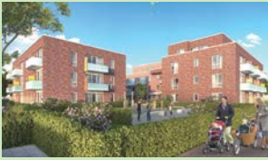
Buekweg 3. Bauabschnitt: Vermietung beginnt Ende Januar 2014