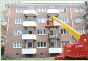
Eilbek und Lohrbrügge: Energetische Sanierung schreitet voran